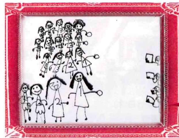
運動会「リレー」 おりおの保育園 5歳児の作品