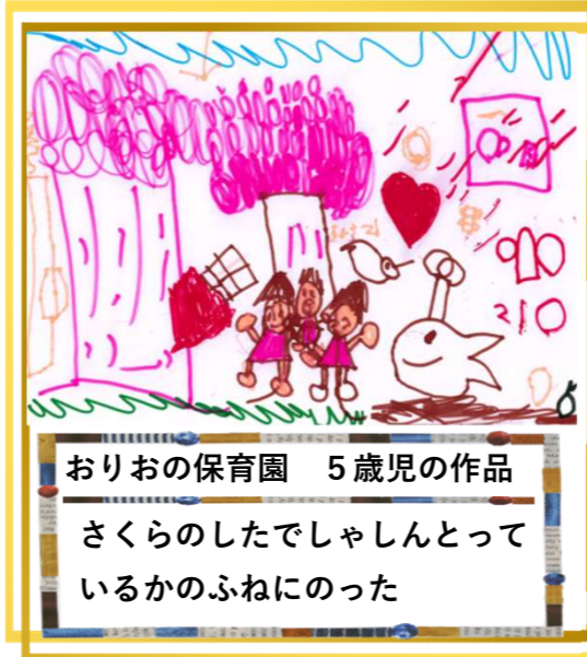
おりおの保育園 5歳児の作品 さくらのしたでしゃしんとって いるかのふねにのった

センターを利用するには利用証が必要です 年齢、住所の確認できるものをご持参ください